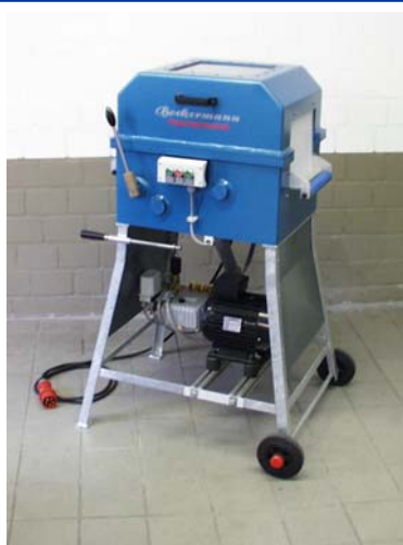
( Schlauchwaschmaschine SW 112/HD mit zusätzlicher Hochdruck – einrichtung)

Fahrbare Schlauchwaschmaschine SW 112/HD zum Reinigen von einem Feuerwehrschauch der Größe D-C-B-A bestehend aus: