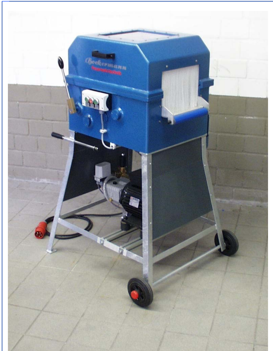
Abbildung SW 112 HD