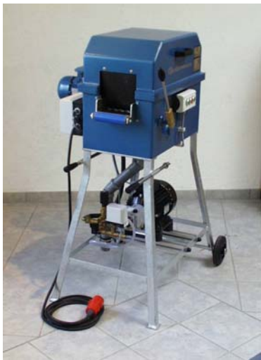
( Schlauchwaschmaschine SW 110/HD mit zusätzlicher Hochdruck – einrichtung)

Fahrbare Schlauchwaschmaschine SW 110/HD zum Reinigen von einem Feuerwehrschauch der Größe D-C-B-A bestehend aus: