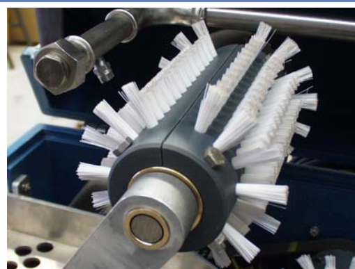
( Geteilte Bürstenhalbschalen für leichten Bürstenwechsel und optimale Wartung )